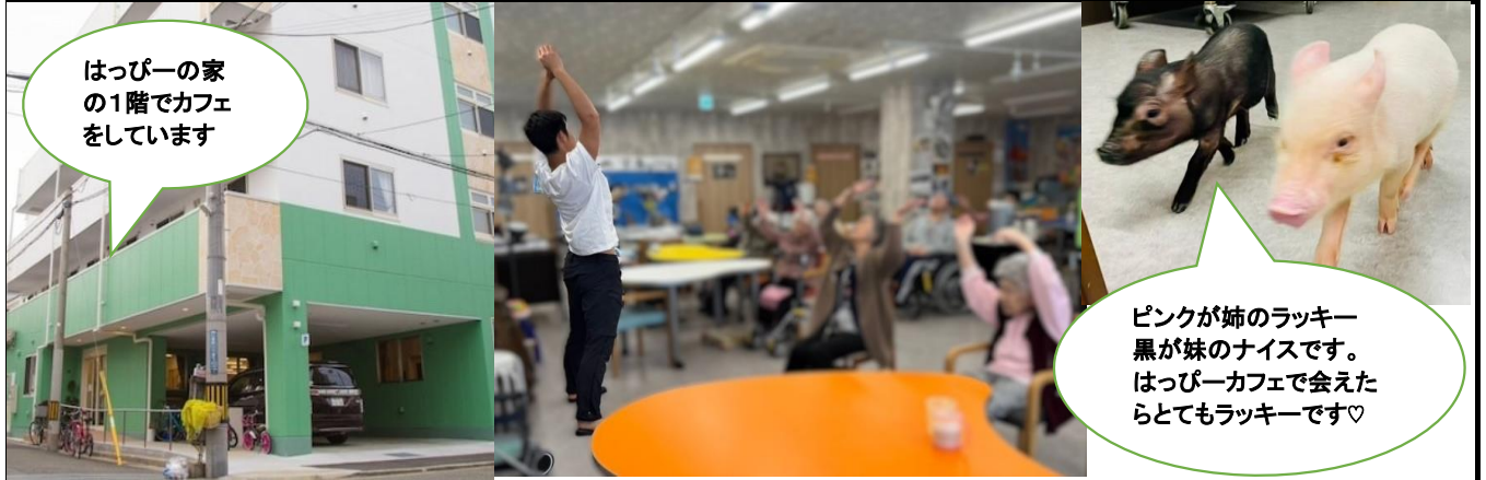
はっぴーの家の1階でカフェをしています