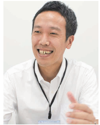
西区社会福祉協議会

皆さんが福祉の現場で輝き、成長していくことを心から応援しています! 共に頑張りましょう!